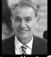
بقلم: جلال محمد حميه نفواه