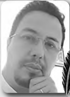
بقلم : حسّان زهار