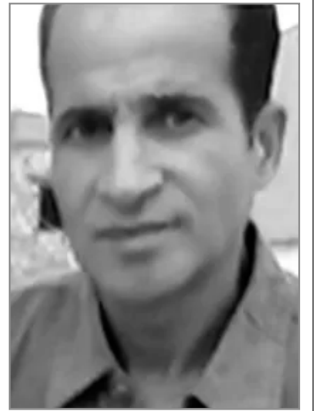
بقلم: جمال نصرالله

على خلفية تشكيل حكومة فلسطينية سوف تعني بعد سنة على توحيد كافة هاته القوى السياسية وتوحد الصفوف. لكن ما جعلني غير سوي نفسيا هو أن إحدى الجرائد العريقة في الوطن العربي، والتي راحت تناول هذا الحدث بامتعاض شديد، ويقول نائب رئيس تحريرها، بأن مخرجات هذا اللقاء كان حديثا فضفاضا، ومجرد وعود هلامية. وقد سبق وان اجتمع هؤلاء الفرقاء عام 2015 بدولة مصر لكن نفس الفصائل ظلت تغرد خارج السرب، وكل يغني على ليلاه، ومنهم حتى الذي كانت تجمعهم علاقات وطيدة بالكيان الصهيوني سريال(وهو طبعاً يقصد الفصائل الفلسطينية). ولم يكتف هذا الكاتب الذي خصص أكثر من نصف صفحة لمقاله بدم هذه الفصائل، التي تعيش ازدواجية في الشخصية، بل راح يطعن في مصداقية ما ستؤول إليه نتائج هذا اللقاء التاريخي وعن أنه كباقي اللقاءات وسطحي مثل المبادرات السابقة، ويستحيل الوفاق، في كل الأحوال، لأنه لم يحدد ويضبط تواريخ وخطوات