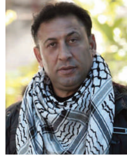
بقلم: جلال حسين نشوان

ما أعذب قلوبهم، الطاهرة، وما أجمل أنفاسهم العذبة، كانوا يحملون بلغة جميلة، تشعب أحاسيسهم المرهفة، لكن حمم الطائرات الأمريكية الشعة الصنع كانت أسرع من أحلامهم، أرواح نقية، صادقة، لا يحملون الكره، لا يعرفون الحقد، والابتناسمة لا تفارقهم. كالفراشات الجميلة، أنفاس عذبة وسحابات طاهرة، عالم مزدان بقلوب صافية، يا الله، كيف للرازيين والنازيين الجدد أن يغتالوا البراءة؟ ألم يدرك مجرمي الحرب أن هناك أطفال يحملون بغد جميل؟ لماذا يصمت العالم الذي يتغنى بالرفي عن جرائمهم؟ إن إطفال فلسطين، قصة حلم، وقصيدة أمل،