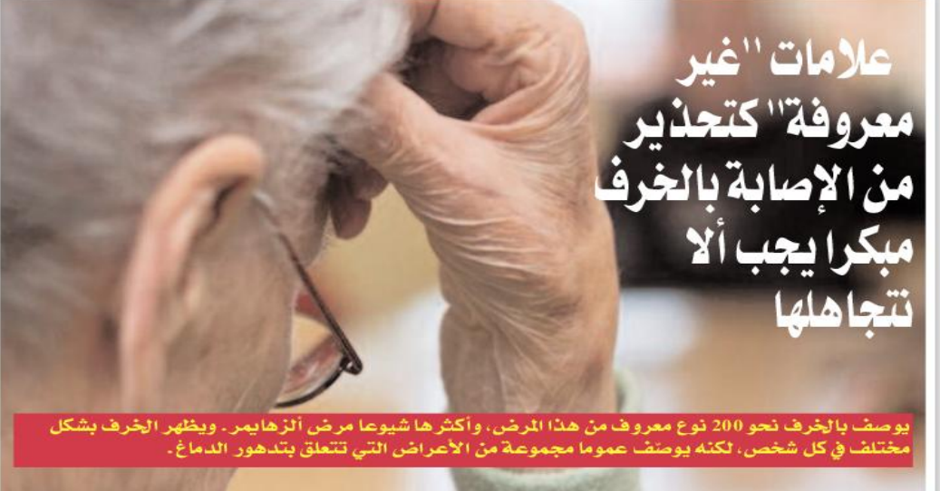
يوصف بالخرف نحو 200 نوع معروف من هذا المرض، وأكثرها شيوعا مرض ألزهايمر. ويظهر الخرف بشكل مختلف في كل شخص، لكنه يوصف عموما مجموعة من الأعراض التي تتعلق بتدهور الدماغ.

وحسن الحظ، هناك أيضا وفرة من الأطعمة النباتية الغنية بالكالسيوم التي يمكنك تضمينها في وجباتك مثل فول الصويا والتوفو والفول والحمص والأعشاب البحرية والبرترقال والتوت.