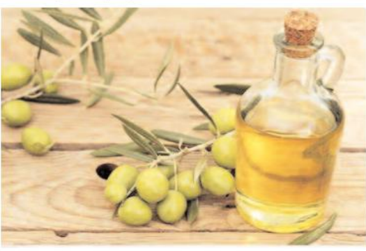
يعد الكالسيوم، الموجود بشكل شائع في منتجات الألبان، ضروريا لبناء والحفاظ على عظام قوية، ووظيفة العضلات المناسبة، وإطلاق الهرمونات. وبدون الكالسيوم الكافي، يمكن أن تضعف عظامنا مما يجعلنا عرضة لهشاشة العظام والسكري. ونظرا لأن أكثر مصادر الكالسيوم شيوعا لا تتوافق مع نظام غذائي نباتي، يتعين علينا إيجاد طرق أخرى للحصول على 700 مغم من الكالسيوم الموصى بها. ويوجد الكالسيوم بشكل شائع في الفيتامينات المتعددة ويمكن أن يساعد تناول واحد كل يوم في سد الفجوات الغذائية المتعددة.

تم رصد آثار مشيطة للأوليك على الجينات المسرطنة، وتأثيراتها على موت الخلايا المبرمج. يقوي جهاز المناعة عبر تنظيم الخلايا المرتبطة بالتهابات.