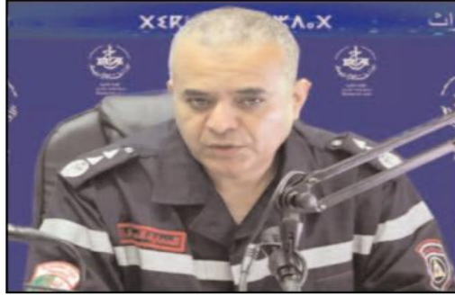
إسعاف المصابين بهدف تقليل الوقت ما بين طلب النجدة ووصول الإسعافات مؤكدا أنها هذه الفرق من جانب آخر، أوضح العقيد فاروق عاشور أن حوادث المرور لا تزال تترك بال مصالغ الحماية المدنية رغم كل الجهود التي بذلت من أجل الحد منها.

كشف مدير الإحصائيات والإعلام بالحماية المدنية، العقيد فاروق عاشور، عن تجنيد 19 ألف عون من الحماية المدنية على مستوى 505 وحدة تدخلية، في إطار حملة مكافحة حرائق الغابات خلال هذه الصائفة.