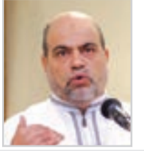
● بقلم: أبو جرة سلطاني

بإقامة السدِّ تحقّق مقصد دزء المفسدة، ولكنّ ذا القرنين لم يبرح القوم حتّى وضع لهم معالم فقه شكر النعم وبضرمهم بما سيكون من أمر هذا السدِّ قبل قيام الساعة: ((قَالَ هَذَا رَحْمَةٌ مِنْ رَبِّي فَإِذَا جَاءَ وَعْدُ رَبِّي جَعَلَهُ دَكَّاءَ وَكَانَ وَعْدُ رَبِّي حَقًّا)) (الكهف: 98). لما فرغ من بناء السدِّ وتحقّق المقصد من إقامته وأيقن أنّ تسلكه، أو الظهور عليه؛ أمر غير متاح لياجوج وماجوج، وأنّ خزقه والنفاذ من خلاله إجراء مستحيل. أعلن أمامهم أنّ الله قد أرسله رحمة بهم في الحياة الدنيا. أمّا يوم الحساب فلا تنفع معه السدود ولا المصدات ولا الحواجز.