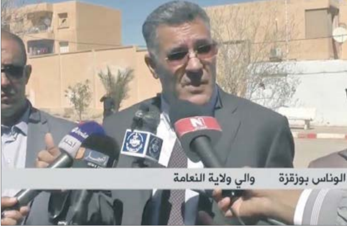
الوناس بوزقزة والي ولاية النعامة

كشف، مساء الأحد، والي النعامة لونس بوزقزة، خلال أشغال المجلس الشعبي الولائي، أن عملية استعادة الأوعية العقارية غير المستغلة من قبل ما أسماهم بـ «سماسة العقار»، كللت وفق النتائج الأخيرة بإلغاء 774 عقد في إطار مخطط تطهير العقار الفلاحي والصناعي وتحديد هوية المستثمر الحقيقي من عدمه.