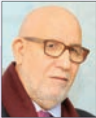
■ د / عبد الوهاب دريال وزير ودبلوماسي سابق

الإنسان هو الأدمي دون النظر إلى عرقه أو دينه أو لونه أو مكان تواجده. وقد خصّ الإنسان بالتكريم دون بقية المخلوقات، قال تعالى: "ولقد كرمنا بني آدم". ولعل ذلك من أهم الأسباب التي جعلته يُفرد بحقوق لم تُقرّر لغيره.