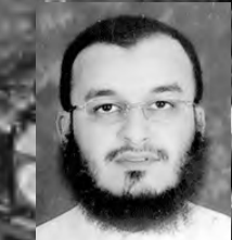
من إعداد: أبو جرير