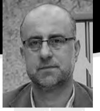
بقلم: د. تاليت حمدي

للشهيد كرامات لم تخطف بالنا لخطتها إلا بعد الفراق، حينه نبدأ بالقرأة لكل حدث، لكل ذاكر، ولكل كلمة، وبسمة، هو يدركها ولا ندرتها، يراها ولم نرها، الشهداء وحدهم يزال عنهم الحجب، ويتصرفون بلغة الغيب اللامحدود، لا لغة القريب والمنظر.