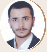
بقلم: إبراهيم أبو عواد 9 ص