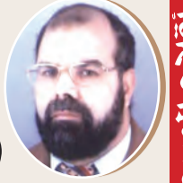
بقلم: محمد مصطفى حابس 7 ص