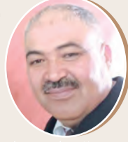
بقلم: الحفناوي بن عامر غول الحسني 10 ص