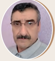
بقلم: بلخيري محمد الناصر 9 ص