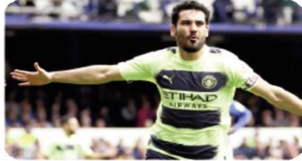
جديد يلبي رغبات غوندوغان وشروطه الختلفة. ويبينت الصحيفة أن العرض الجديد من مانشستر سيتي سيكون أعلى من عام 2021.

كشفت صحيفة "ستداي تايمز" البريطانية الأحد، أن الدولي الألماني إيلكاي غوندوغان يتجه للبقاء ضمن صفوف فريقه مانشستر سيتي بطل الدوري الإنجليزي، وتجاهل عرض برشلونة بطل الدوري الإسباني، من أجل حصوله على خدماته.