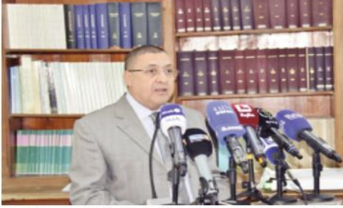
مضيفاً أنه تم وضع خارطة طريق تسمح بمشاركة مختلف القطاعات الوزارية من أجل اتخاذ إجراءات استباقية يتم تصييدها وفقاً لمعايير ومقاييس مضمونة. وخلص الوزير إلى التأكيد بأن الأوباب المتوتحة التي ينظمها المركز هي مبادرة محدودة يجب تعزيزها وتنويعها لبراز الدور الفعال الذي ينبغي أن تلعبه جميع فعاليات المجتمع في مسار النكفل الأمثل بالمخاطر الكبرى.

كشف وزير الداخلية والجماعات المحلية والتهيئة العمرانية، إبراهيم مراد، الأحد بالجزائر العاصمة، أن مصالحة تمكف على مراجعة "شاملة" للأساس التشريعي للمنظومة الوطنية للمخاطر الكبرى، مؤكداً أن الدولة "لم تدخر أي جهد للحفاظ على أمن المواطنين وممتلكاتهم".