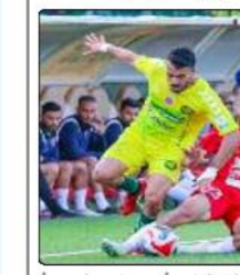
حدثت رابطة دوري المحترفين الجزائري، يوم 4 جويلية المقبل، موعدا لإجراء آخر مباراة في موسم 2022-2023. وكشفت الرابطة في بيان نشرته عبر موقعها الرسمي، أن الجولة 24 ستلعب يوم الثلاثاء 30 أيار/مايو الجاري، باستثناء المباراة التي يحل فيها اتحاد الجزائر ضيفا على شبيبة الساورة التي ستلعب يوم الرابع من شهر جويلية المقبل. وأوضح ذات المصدر، أن الجولة 30 والأخيرة ستقام يوم السبت الأول من تموز/يوليو، بينما تحددت مواعيد الجولات 25 و26 و27 و28 و29، في الفترة من 6 حزيران/يونيو إلى 27 من الشهر نفسه. يذكر أن اتحاد الجزائر المشاهل إلى نهائي كأس الكونفيدرالية الإفريقية، يواجه مضيقه وجاره نادي أولمبيك بارادو عدا الأحد، في مباراة مؤجلة من المرحلة 20. يذكر أن اتحاد الكرة الجزائري، كان قد حدد في وقت سابق تاريخ 18 آب/أغسطس موعدا ل انطلاق موسم 2023-2024.