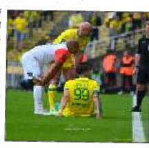
الفرنسي، ويحثل الفريق المركز 17 برصيد 33 نقطة في جدول الترتيب.