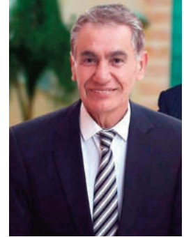
بقلم: جلال حسين نشوان

أصحاب الضمائر الميتة والنفوس الخرية. هؤلاء سواء كانوا سياسيين أم حقوقيين ونقابيين... تلوك أنسة المطيعين ودعاة حقوق الإنسان ليل نهار بكلمات لم نعد نعيها ولكنهم كالبلهاء يرددون كلمات فارغة، ومن ضمن شعاراتهم الفارغة، أن الصهيونية قد تحطت كل الخطوط الحمراء، كلمات كالعلكة تتناقلها الألسنة بين مطاحن اليمين ومطاحن اليسار إلى أن يبتدأ جوف الفم وينفخه بين الشفتين تلق العلكة على مداس الطرقات، ورغم هذا الواقع المزري ورغم مرارة الخذلان والصمت بقينا نناضل حتى آخر رمق، لقد أضحقت قضيتنا الأولى عند الغرب و العرب مسرحية هزلية، هزلت حتى هزلتها، مسرحية تطرب لها الصهيونية، بينما، تسترزق منها الجوقات العربية المطيعة المتولولة بالسياسة والمتعطرة بالتطبيع والمدمجة بالكذب، جوقات تغنى بالتطبيع دون استحياء حتى تحظى العرب الخطوط الحمراء للتردد والانكفاء وتحطوا كل مدى، وأفرغ المدى من مداه... ذات يوم، بكى الشاعر علي محمود طه، وعبد الوهاب رتل الحزن، وخبت وولت صرخة أخي جاوز الظالمون المدى... وأصبحت الأجيال العربية الحاضرة لا تفقه معناها فكيف بمداه...!!!!!! إن لصرخة المظلوم معنى وبعد المعنى مدى، صرخات مدوية طالت أعنان السماء، وحزن ملأ القلوب رجالاً ونساء، شيوخاً وأطفالاً، هطلت الدموع، رحل الشهداء وبقيت ذكرياتهم