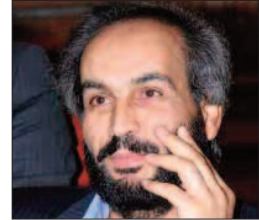
بقلم: حسن حسن

خطفت (هياطين) فكانت المرأة، وللمرة الأولى في التاريخ، مرة للكرامة، وسعيًا لاستعادتها؛ وكانت الأوديصة الضيفة الأخرى للحياة كلها، أعني المكان (إنيكا) مملكة أوليسس! والمدهش في الكتاين معاً هو أن الزمن كان متمثالاً في كتاين الضيفين، عشر سنوات أمضاها الإغريقي في استعادة الكرامة، وهيا الزمن الفيزيائي الذي عاشوه طوال حرب شرسة كانت صورتها الأبدى في الفقد، والخراب، وتعطيل الحياة، وعشر سنوات أمضاها ملك (إنيكا) أوليسس وهو يحاول العودة إلى المكان! لقد كانت الكرامة حلماً كبيراً وشاسعاً في (الإلياذة) وكان المكان حلماً كبيراً وشاسعاً في (الأوديصة) أيضاً، وكلاهما: الكرامة والمكان، شكلاً اجتماع حياة الإغريقي تمثيلاً للوعي بالحياة، وعشقاً للمكان. أقول هذا، وأشير إليه، في هذه الآونة، وأنا أقرأ المدونة الأدبية التي يكتبها أسرانا في سجون عدونا الإسرائيلي ومعتقلاته، فلا