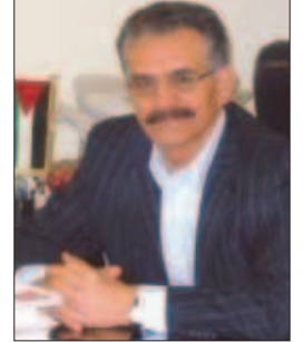
بقلم: د. عبد الرحيم جاموس

خمسة وسبعون عاماً ( 1948/5/15 - 2023/5/15 م ) تمّ اليوم على عمر النكبة الوطنية الفلسطينية والقومية العربية، والإسلامية والمسيحية والإنسانية، والتي تجسدت في عام 1948/05/15م عندما أعلنت بريطانيا العظمى انذاك نهاية إبتدائها على فلسطين، وإعلان العصابات الصهيونية على كيان الإغتصاب الصهيوني على أكثر من 78٪ من مساحة فلسطين، وما نتج عنه من تشريد وتهجير قسري لأكثر من 850 ألف نسمة من شعب فلسطين، وتحولهم إلى لاجئين في مخيمات بقيت شاهدة إلى اليوم على جريمة العصر وعلى أكبر جريمة إنسانية شهدتها المنطقة، والتي مثلت زلزالاً لا زالت هزاته الارتدادية تعصف بالمنطقة، فلسطين مركز هذا الزلزال المدمر الذي لم يهدأ، ولن يهدأ، ولن تهدأ المنطقة معه، إلى أن تنتهي وتزول كافة آثار الزلزال المركزي الذي ضرب فلسطين في الخامس عشر من أيار للعام 1948، فهل يدرك الأشقاء العرب ومعهم العالم أجمع هذه الحقيقة؟! إن مؤسسة سيدة الارض الفلسطينية ومؤسسة مركز التراث الفلسطيني في تونس الشقيقة، تحيا