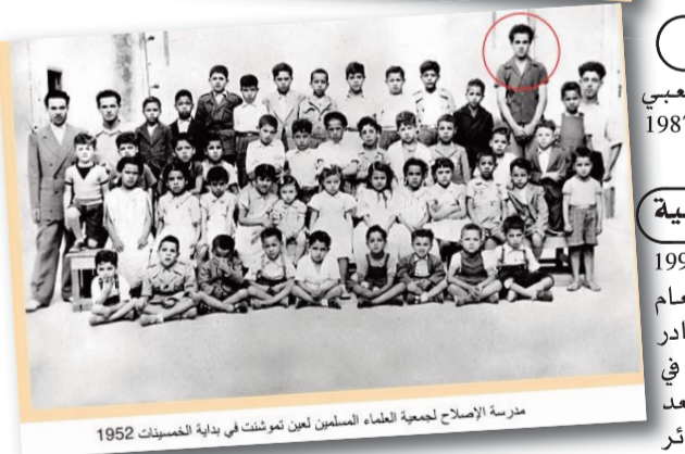
مدرسة الإصلاح لجمعية العلماء المسلمين لعين تموشنت في بداية الخمسينات 1952