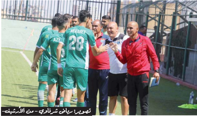
بالسقوط، بعد سقوط «الوات». وعلى إدارة الجمعية استخلاص الدروس من هذا الموسم الذي يعد الثامن للازمو في بطولة القسم الثاني لتكون ثاني أطول فترة يعمر فيها الجماعوة في هذا القسم قبل الصعود الأخير إلى قسم النخبة.

● المهاجم مرابط إلياس خارج الحسابات بسبب الإنذارات