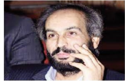
بقلم: حسن حميد