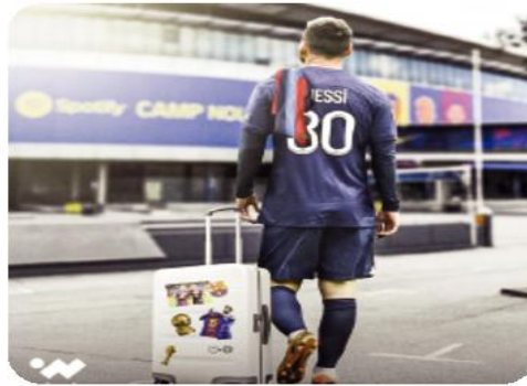
ميسي لارتداء قميص الفريق مرة أخرى، فالأولى سيحصل البلوغرانا على 150 مليون يورو من دخول رعاة جدد عقب عودة البوغفا مرة أخرى. كما يفصل التقرير الاقتصادي عدة جوانب مثيرة للاهتمام تعمل على

ويمنته عقد ميسي أفضل لاعب في العالم (7) مرات، مع باريس سان جيرمان في نهاية الموسم الجاري 30 جوان 2023، ولم يتوصل النجم الأرجنتيني بعد إلى اتفاق بشأن التجديد، رغم أن عقده ينص على التمديد لموسم آخر اختياري.