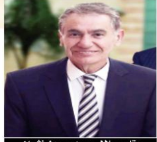
يقلم: جلال محمد حسين فشان

مسرحة هزلية، هزلت حتى هزلتيتها، مسرحية تطرب لها الصهيونية، بينما، تستررق منها الجوقات العربية المطبوعة المتلونة بالسياسة والمعطرة بالنطبيغ والمديجة بالكذب، جوقات تتقن بالنطبيغ دون استحياء حتى تخطى العرب الخطوط الحمراء للتردد والانكفاء وتخطوا كل مدى، وأفرغ المدى من مدها... ذات يوم، بكى الشاعر علي محمود طه، وعيد الوهاب رتل الحزن، وخبت ولت سرخة أخي جاوز الظالمون المدى... وأصبحت الأجيال العربية الحاضرة لا تفقه معناها وكيف بعدها...!!! إن سرخة الظالمون معنى وبعد المعنى مدى، صرخات مدوية طالت عتاش السماء، وحزن ملا القلوب رجلاً ونساء، وشيوخاً واطفالاً، هطلت الدموع، رحل الشهداء وبقيت ذكرياتهم الجميلة، تلا مس مشاعرنا وأحاسيسنا، تقاطرت أعيننا دماً بدل الدمع على رحيل الأكرم منا جميعاً، أبنائنا في غزة وجبل النار وجنين وأريحا والقدس، أجهشنا بكاء على أنفسنا، على حالنا المأساوي الذي وصلنا إليه، على مستوى الانحطاط الذي نعيشه واقعاً متجسداً في صمت بلداننا العربية والإسلامية!!!!!! ورغم جحيم العدوان، سنظل ندفع الدماء دفاعاً عن شرف الأمة ومقدساتها الإسلامية والمسحية 11/11!! وذوي القربى، على هذا الحال متفرجين، سامتين، بلا أحرف تعبير عما في داخلنا بما يحرق أفئدتنا، بلا كلمات، بلا روح، بلا جسد، بلا معنى لوجودنا، حتى الشجب والاستنكار رحل وبلا عودة، نحن نصرخ، سامحين الله، فلا أحد يبالي، العسا الأمريكية غيلقة، والجال يرثي له و كل عروبي كأنه يعيش في غرفة عزالة للصوص لا يسمع إلا ما يشاء و ما يريد، فلسطين تذيب من الوريد إلى الوريد، بلداننا العربية والإسلامية متفرجين، سامتين، يا لعارهم، ويا لبيشاعتهم، نعيش اللحظة الحرجة من التاريخ ولكننا شامخين، أعزاء، عظماء، أما هم، غير مدركين بأنه قد يكون الغد