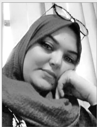
الخطوات بين الأوراق

الثقافة على دعمها للفنان والاديب وعلى المجهودات المبذولة من اجل الخلق الثقافي كما اهديكم هذه القصيدة وهي ترجمة لعمل التنصيبة للفنان العالمي وتونسي حمادي لوحيشي