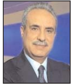
بقلم: محمد كrichان

قلة هي تلك التي تريد التوقف قليلاً لمتابعة حالات هؤلاء المهاجرين وكيف دفعت بهم قسوة الحياة وانسداد الأفاق إلى مثل هذه المفامرات مع علمهم أن الموت يترتبُ بصحبتهم. وإذا ما استثنينا ما تعرفه جيداً مثل المنظمة الدولية للهجرة والصليب الأحمر والكثير من منظمات المجتمع المدني الأوروبية المعنية برعاية هؤلاء عند وصولهم إلى الشواطئ الأوروبية من قصص مؤلمة لكل واحد من هؤلاء، فإن القليل من الأضواء قد تكون سلطت على هذه الحالات الإنسانية الجديرة بالرصد، منذ انقطاع كل واحد من هؤلاء عن الدراسة ومعاناته الحرمان والبطالة وصولاً إلى اتخاذ قرار ركوب قارب متهالك لا يدرى إن كان سيوصله إلى بر الأمان أم لا، بعد أن يكون دفع إلى عصابات تهريب البشر كل ما استطاع جمعه من مال من هنا وهناك بصعوبة كبيرة، دون أن تغفل