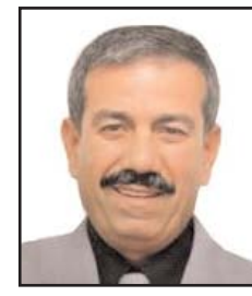
بقلم: حمادة فرااعة

في مواجهة قدرات تفوق المستعمرة، لم ينتظر الفلسطينيون أكثر من يوم واحد للرد على مجزرة مخيم جنين، والنيل من مجموعة من المستوطنين المستعمرين الأجانب في استراحة محطة محروقات على طريق نابلس رام الله، ووجهوا لهم ضربة موجعة سريعة، دفعت كل مؤسسات المستعمرة وقياداتها للهرولة من أجل متابعة الحدث.