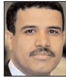
بقلم: محمد جميع

شاهد الصحافي اليهودي النمساوي ليوبولد فايس في القدس مجموعة من المسلمين يقومون بحركات يقرأون أثنائها بعضاً من القرآن، وعرف أن تلك هي صلاة المسلمين، وحاول الاستفسار عن دور الجسد في الصلاة التي يفترض أن تكون عملاً قلبياً خالصاً، فسأل الإمام عن ذلك، وجاء الرد الذي سجله في كتابه «الطريق إلى مكة» في قوله: «بأي وسيلة أخرى تعتقد أننا يمكن أن نعبد الله؟ ألم يخلق الروح والجسد معاً؟ وبما أنه خلقنا جسداً وروحاً ألا يجب أن نصلّي بالجسد والروح؟» في إشارة إلى ضرورة فهم الشعائر الحسية في الإسلام مرتبطة بمحتوياتها الروحية.