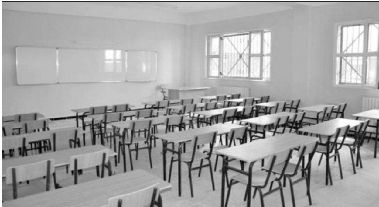
جوان 2022 تحسبا لإعادة استغلالها خلال الدخول

كما يجري بحسب 1300 مسكن عمومي إيجاري بالتجمع السكاني المحقق، التابع لذات البلدية، إنجاز ثانوية تتسع لـ 1000 تلميذ مع نصف داخلية تشارف بها الأشغال على الانتهاء لينتقل إليها مع الدخول المدرسي المقبل قرابة 400 تلميذ يدرسون حاليا بثانوية الأمير خالد بمدينة أرزيو.