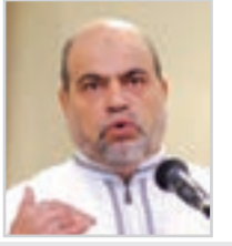
● بقلم: أبو جرة سلطاني

بمجيء ذي القرنين علموا أنهم لا يعرفون أنفسهم. وفهموا أن نظرتهم للحياة تعودها العزيمة على الزشد. وأيقنوا أن تغيير ما بالنفس لا يحتاج إلى مال وخراج وإنما يحتاج إلى رجال فكر وقادة رأي وأساطين علم وفقه وأولي عزم.. فتغيير النفوس هو منطلق كل تحول تلقاء قيادة راشدة تجمع الكلمة وترص الصف وتعلم الإنسان مبادئ التعاون على دفع الشرز بالتضحية ووقف الضرر باستشعار خطره واتخاذ الأسباب المانعة من نبوه واتساع دوائره.