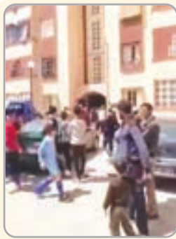
■ طارق. م

وقد حضر صاحب السكن مسرعا، وبعد تفتيش غرف الشقة لم يعثروا على أي شيء، ولكنهم بمجرد غلق الباب الحديدي الخارجي للشقة، يُسمع صراخ المرأة من جديد، وكأنها تستعمل مكبرا للصوت بحسب من تحدثوا للشروق اليومي من أهل المنطقة، وبمجرد فتح باب الشقة يتوقف الصراخ، وبلغ هلع سكان العمارة المتكونة من أربعة طوابق، أن غادروا جميعا إلى ذويهم في مناطق أخرى، وعادوا صباح أمس، السبت، يجرحهم الفضول لمعرفة آخر مستجدات هذا الصراخ الغريب. وبعد تكرار الأمر وانتشار حكاية ما أسموها بالجنية التي تقيم بشقة من ثلاثة غرف، قرّر بعض الجيران المقيمين بالعمارة، مغادرة مساكنهم باتجاه أهاليهم، خوفا من مصير مجهول ربما ينتظرهم على حسب قولهم ولأن أبناءهم سكنهم الرعب بعد انتشار إشاعات مزوجة بالخرافة في ظل عجز عن تفسير الظاهرة، في حين استنجد ساكنة المنطقة، بمن فيهم صاحب الشقة، برقاة من داخل ومن خارج المدينة، لعل وعسى أن يجدوا الحل، لهذه الحادثة التي أضحت على لسان العام والخاص، وتناقلها رواد الفضاء الأزرق ما بين استغراب والمبالغة أيضا.