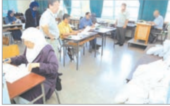
هذه مراحل تسديد النفقات وتحويلها إلى مصالح البريد

● فتح مراكز إجراء "اليام" و"البكالوريا" يومي 3 و9 جوان