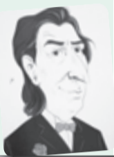
■ بقلم: طاهر حليسي