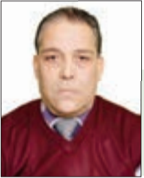
د / محمد بوارابيح

"كليجدار أوغلو" ليس بالمنافس الهين للرئيس طيب رجب أردوغان، فهو مرشح "الطاولة السادسة"، التي تنتظم فيها قوى المعارضة التركية المناهضة لسياسة أردوغان ولسياسة حزب العدالة والتنمية المهيمن على المشهد السياسي في تركيا منذ عام 2002.