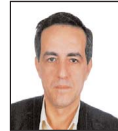
بقلم: صبحي غنود

فهل كان من الممكن لواشنطن أو غيرها من عواصم دولية وإقليمية فاعلة في أزمان المنطقية الآن أن تصادر دور الإرادات الوطنية لو كان هناك حد أدنى من التضامن العربي والرؤية العربية المشتركة لصيغ