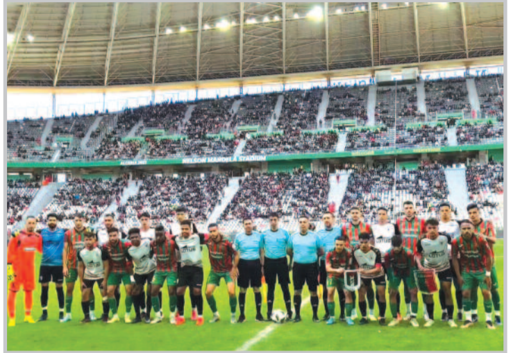
هذا اللقاء التاريخي.