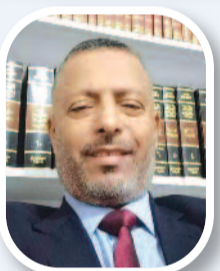
دوام الثناء والمحاسبة..!